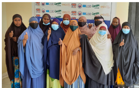
Comité de gestion de la coopérative Hiil-Haween au centre Hiil-Haween à Mogadiscio, janvier 2022.