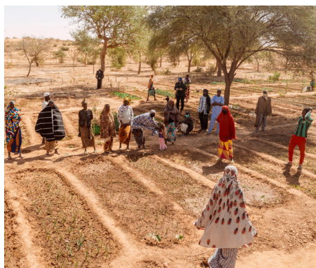
Jardin potager et groupe communautaire du projet RAIN, village de Toungaïlli, Niger, février 2021.

des groupes d'appui aux mères contribuent à promouvoir une meilleure nutrition infantile. L'accent mis par le programme sur l'égalité des sexes a permis à 570 femmes d'avoir accès à des microcrédits pour leur commerce par le biais de programmes d'épargne et de crédit des villages. Désormais, 78 % des femmes jouent un rôle actif au sein d'organes décisionnels communautaires (contre 7 % avant RAIN). Les membres de la communauté gèrent et accèdent également à l'approvisionnement en eau potable de 15 puits de villages, ce qui a des répercussions positives sur la santé, l'hygiène et l'entretien des cultures et du bétail.