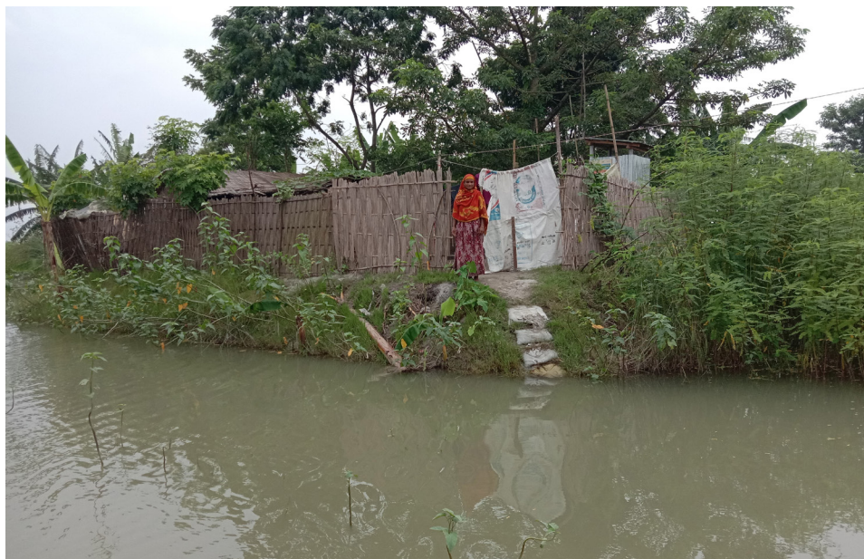
Ferme surélevée et résiliente à Charitabari, Sundarganj, Bangladesh, soutenue par Concern dans le cadre du projet Zurich Flood Resilience Alliance, février 2021.

Depuis 2016, Concern travaille avec la Fondation Z Zurich dans le cadre de Zurich Flood Resilience Alliance (l'Alliance) au niveau mondial et local. L'Alliance est une collaboration multisectorielle de neuf organisations membres issues du secteur