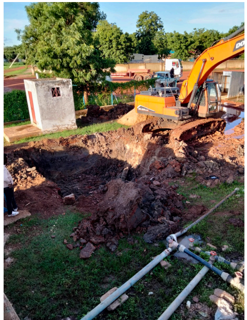
Excavation pour la fondation d'un réservoir en acier pressé dans la station de traitement des eaux de Bentiu, comté de Rubkona, juillet 2022.