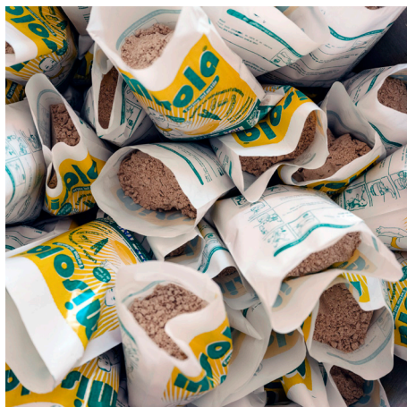
Le produit final de la farine bio fortifiée, prête à être distribuée et vendue, février 2021.

Dans la région de Tahoua, la somme des activités déployées a contribué selon les données des enquêtes SMART à réduire de 3.2% la prévalence de la MAG et à augmenter de 6.6% la diversité alimentaire minimum chez les 6 à 23 mois, entre 2018 et 2021 ainsi qu'une augmentation de 33.3% du taux d'allaitement maternel exclusif entre 2019 et 2021 . Un travail de pérennisation des acquis du programme a été complète à travers l'élaboration de plans d'actions pour soutenir les activités de mobilisation communautaire.