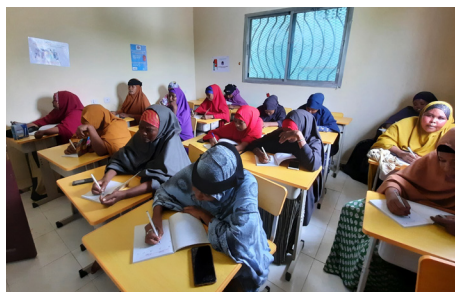
Cours d'alphabétisation et de calcul du groupe d'entraide au centre Hiil-Haween à Mogadiscio, janvier 2022.