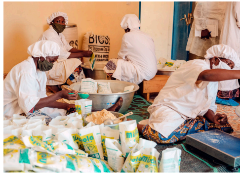
Le personnel de MISOLA emballe les farines enrichies dans des sacs prêts à être distribués, février 2021.

La connexion avec MISOLA a permis aux producteurs de pouvoir étendre leur champ d'action en terme de marché, ce qui leur a permis de faire une vente à un niveau plus large localement. En plus, le prix à la vente est supérieur (14% de plus) contre le mil local, ce qui entraîne une augmentation des revenus des producteurs.