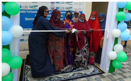
Cérémonie d'inauguration du centre coopératif Hiil-Haween à Mogadiscio, août 2021.