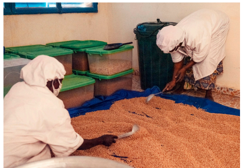
Deux membres du personnel MISOLA renversent les graines de soja grillées sur une nappe et les étalent sur toute la surface pour les refroidir, février 2021.