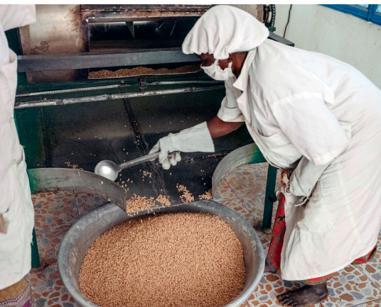
Des membres du personnel de MISOLA grillent légèrement les graines de soja sur feu doux, sans les brûler afin d'éviter de donner un goût acide à la farine, février 2021.

utilisent cet argent au profit de leur famille (alimentation, éducation, santé etc.), réduisant ainsi petit à petit la pauvreté.