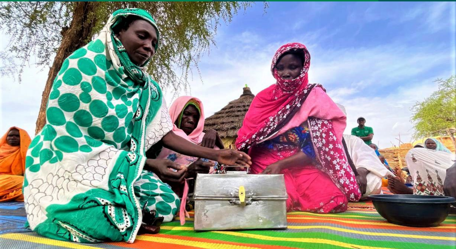
Membres d'une AVEC appuyée par DIZA-Est lors de leur réunion hebdomadaire d'épargne à Koutoufou, dans la province du Sila (2022).